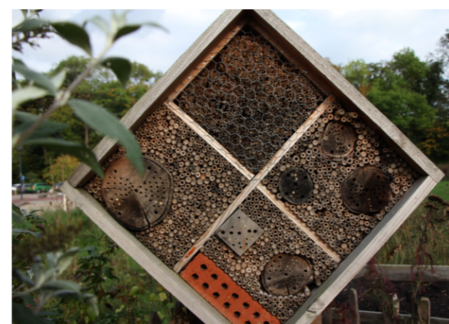
Hôtel des abeilles