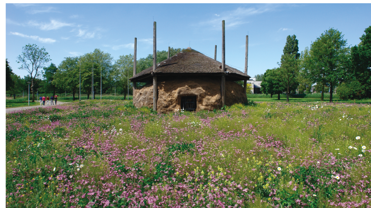
Site HEINEKEN à Zoeterwoude

Mettez en place des toits végétalisés et riches en herbes. Laissez les murs se couvrir de plantes endémiques grimpantes et en escalier. Elles fournissent de la nourriture et des lieux de nidification aux pollinisateurs sauvages. Un hôtel à abeilles contre un mur sud ou sur le toit offre des possibilités de nidification supplémentaires.